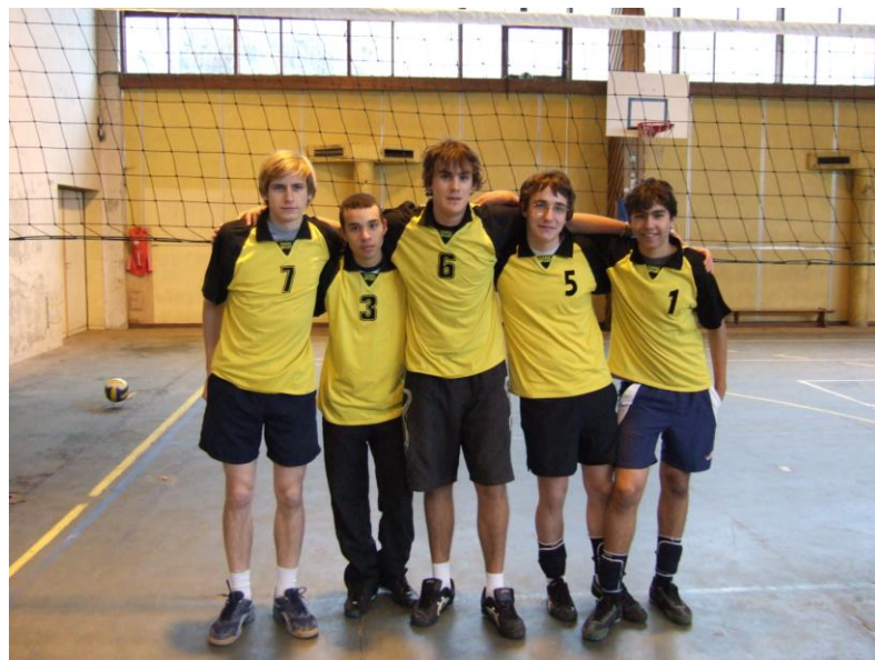
Les juniors garçons (JG) :