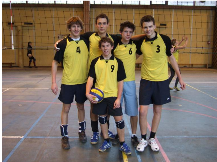
Les cadets garçons 1 (CG1):